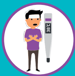
ПОВЫШЕННАЯ ТЕМПЕРАТУРА ТЕЛА