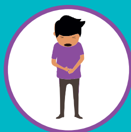
БОЛЬ В ЖИВОТЕ