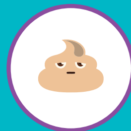
ИЗМЕНЕНИЕ ЦВЕТА КАЛА