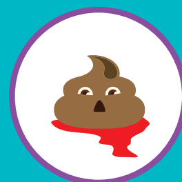
ПРИМЕСИ В КАЛЕ (СЛИЗЬ, КРОВЬ)